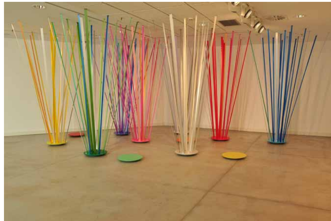
Show Window [ 2012 ]