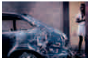
Fig. 006 Gonaives, Haiti [1987] 50,8 x 76,2 cm