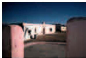
Fig. 002 Boquillas, Coahuila [1979] 75 x 101 cm