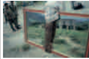
Fig. 015 Palmapampa, Peru [1993] 76,2 x 101,6 cm