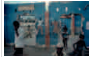
Fig. 020 y Portada Port au Prince, Haiti [1986] 76,2 x 101,6 cm