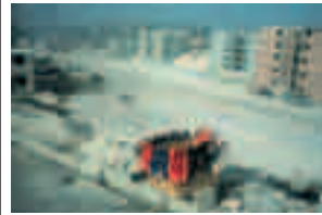
Fig. 019 Outskirts of Tijuana, B.C. [1995] 75 x 101 cm