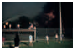
Fig. 010 Palm Beach County, Florida [1988] 76,2 x 101,6 cm