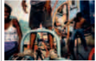
Fig. 016 Havana, Cuba [2000] 76,2 x 101,6 cm