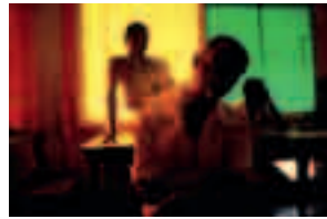
Fig. 018 Grenada [1979] 50,8 x 76,2 cm