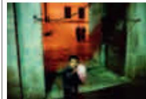
Fig. 004 Istanbul, Turkey [2001] 76,2 x 101,6 cm