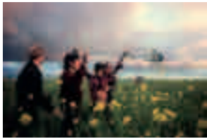
Fig. 017 San Ysidro, California [1979] Arrest of border crossers 75 x 101 cm