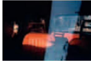
Fig. 014 Havana, Cuba [2000] 76,2 x 101,6 cm