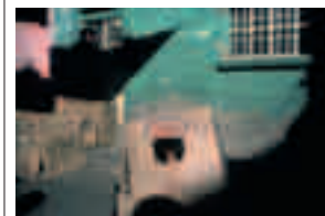
Fig. 008 Leon, Mexico [1987] 50,8 x 76,2 cm