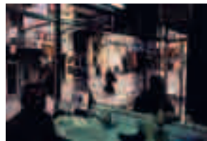
Fig. 003 Istanbul, Turkey [2001] 76,2 x 101,6 cm