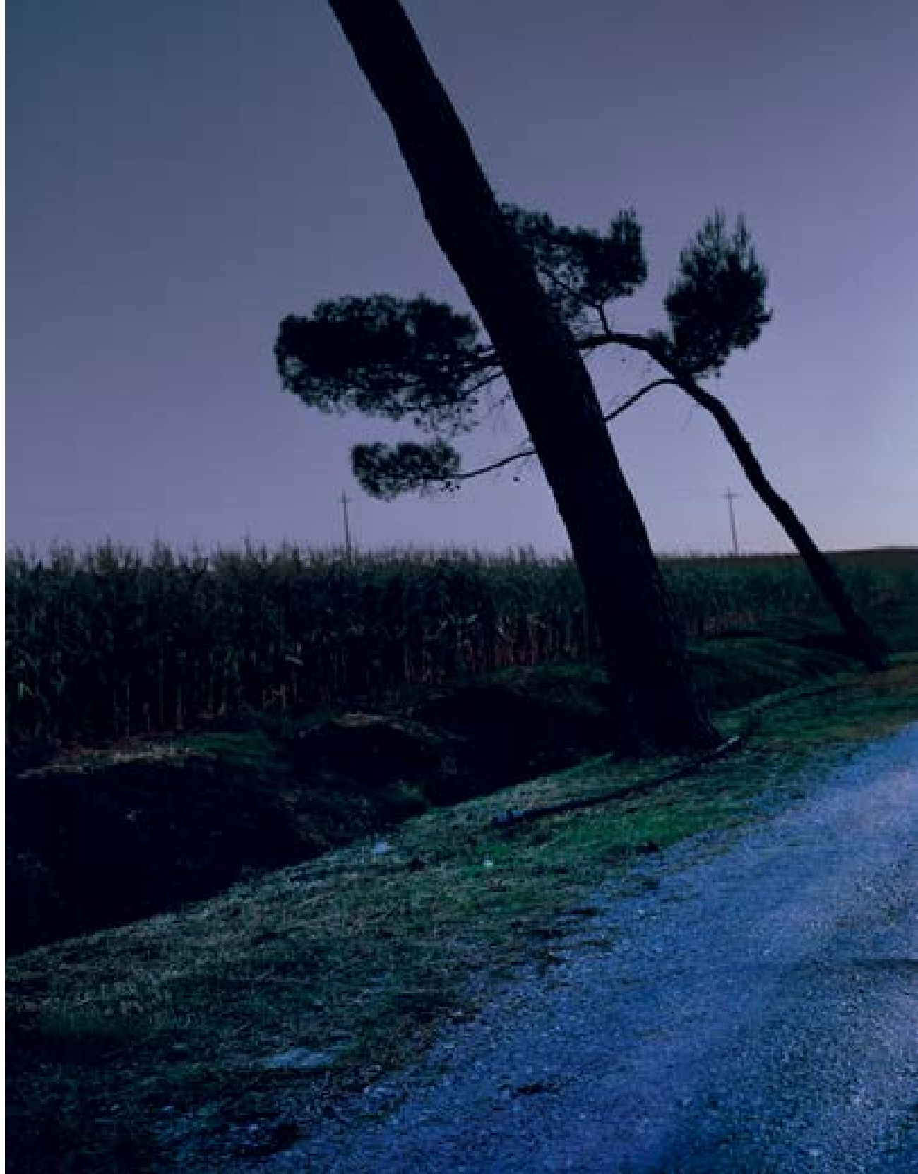
Montaltese – crossing , 2009 60 x 127 cm