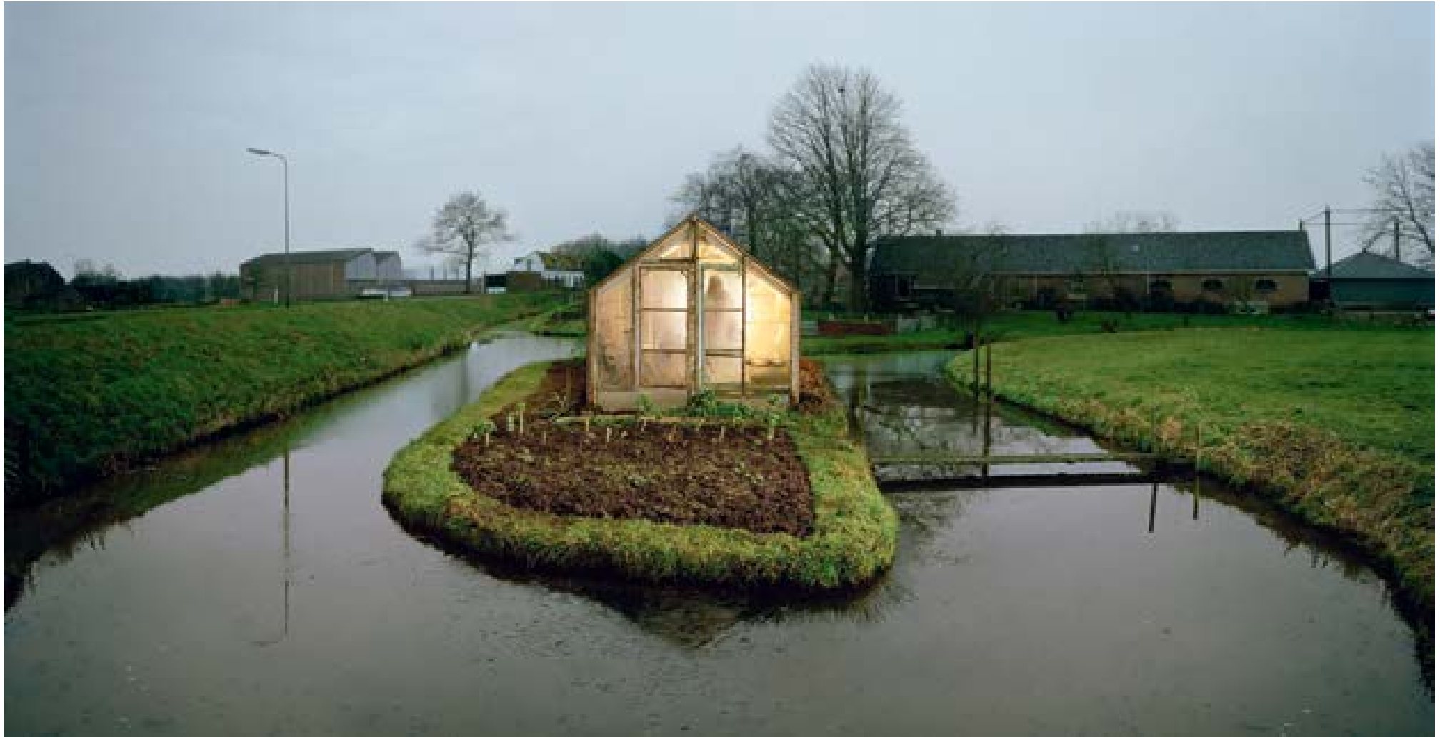
Zwammerdam - kas , 2005 90 x 175 cm