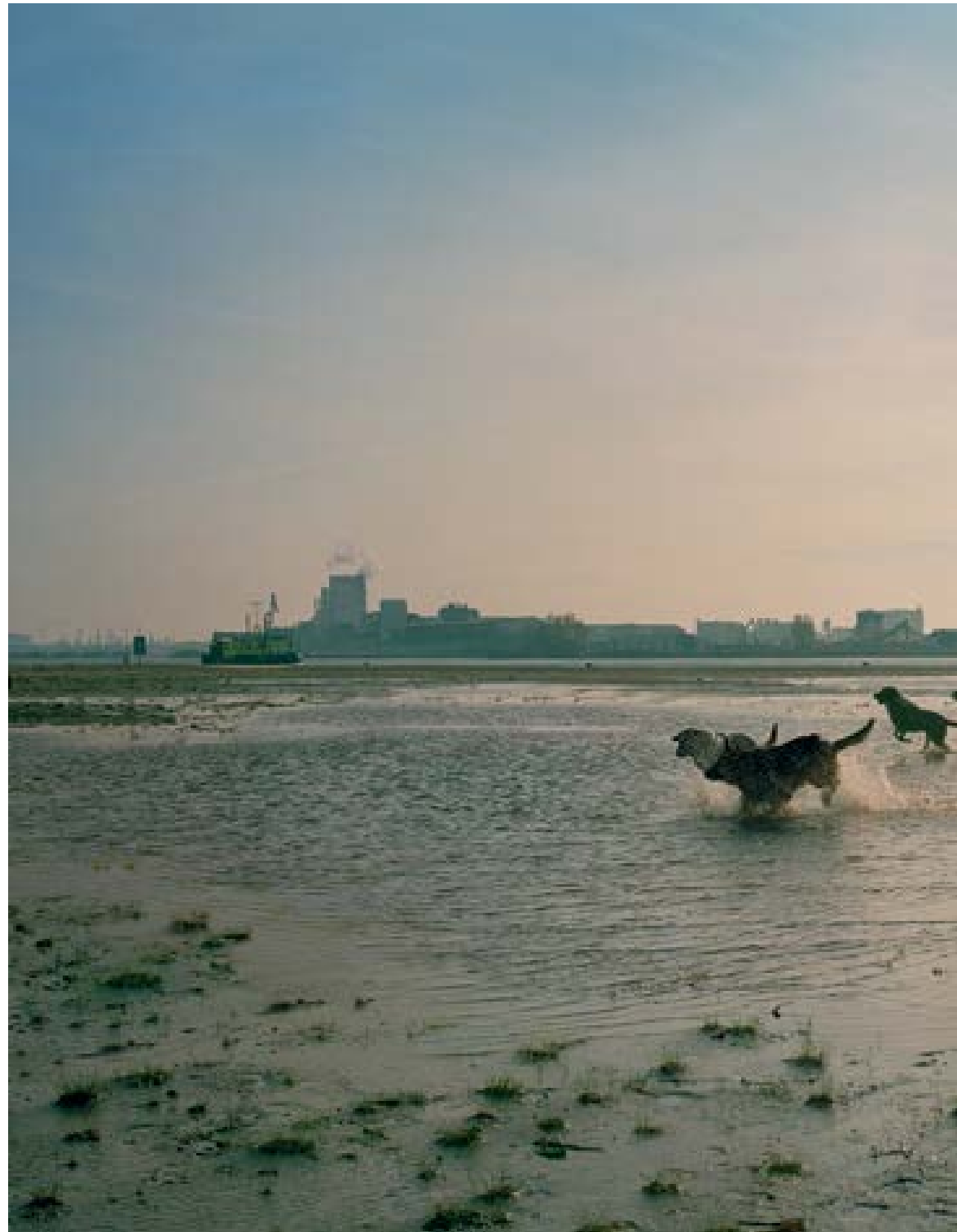
Amsterdam – honden , 2005 85 × 190 cm