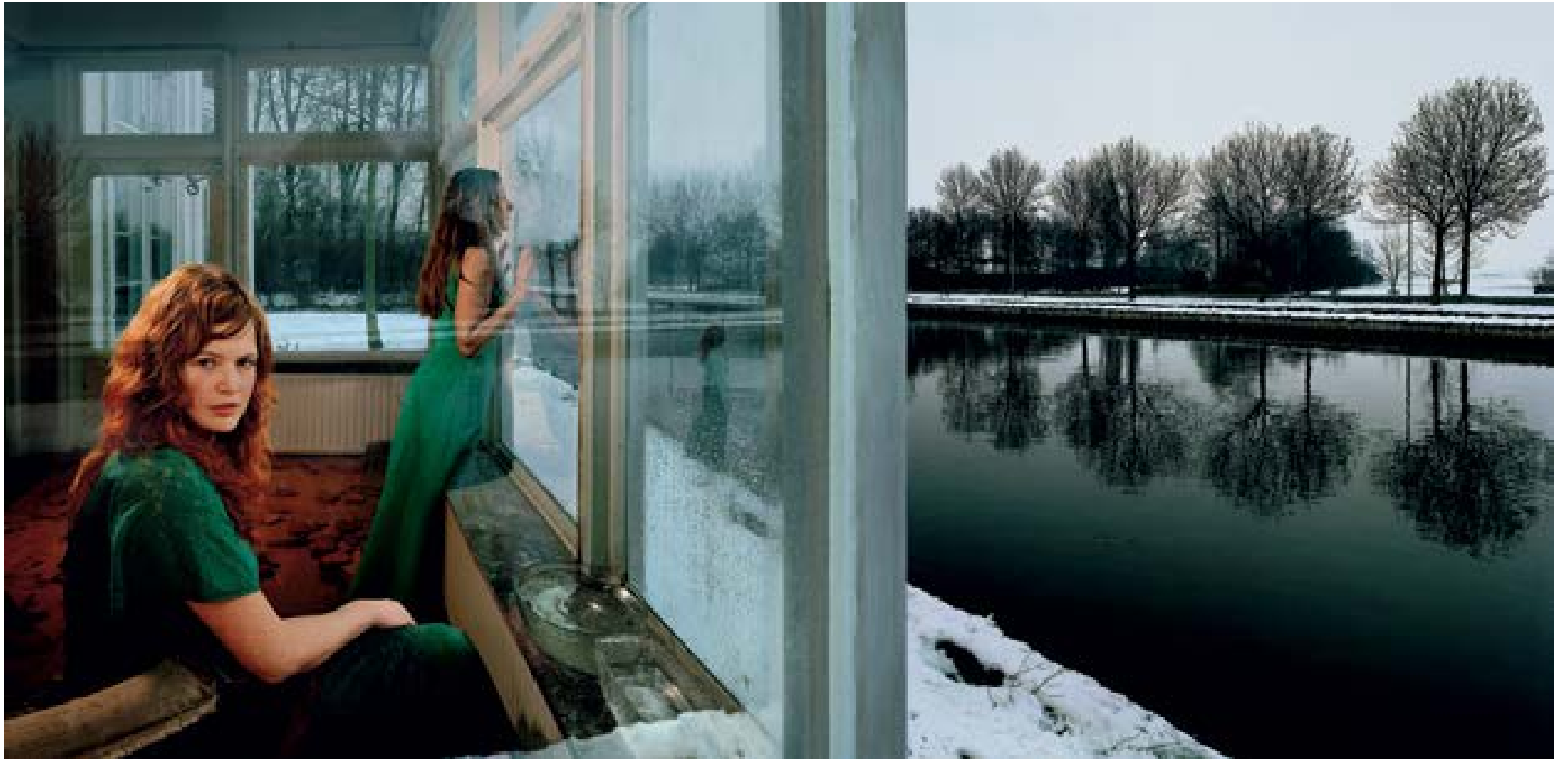
Hazerswoude - Tsjechov, 2005 85 x 175 cm