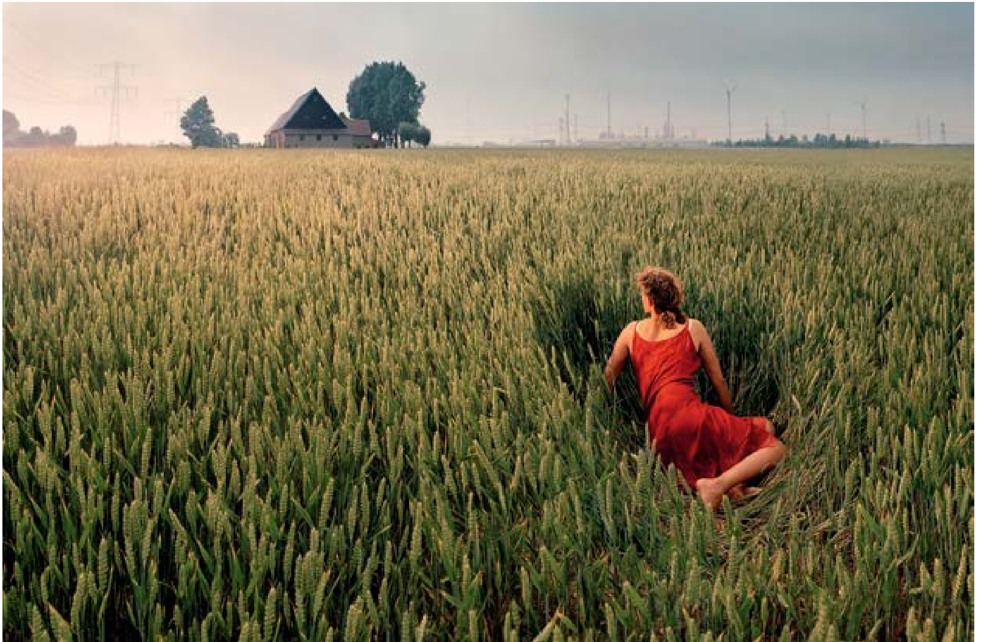
Borsele – rode jurk , 2007 150 x 110 cm