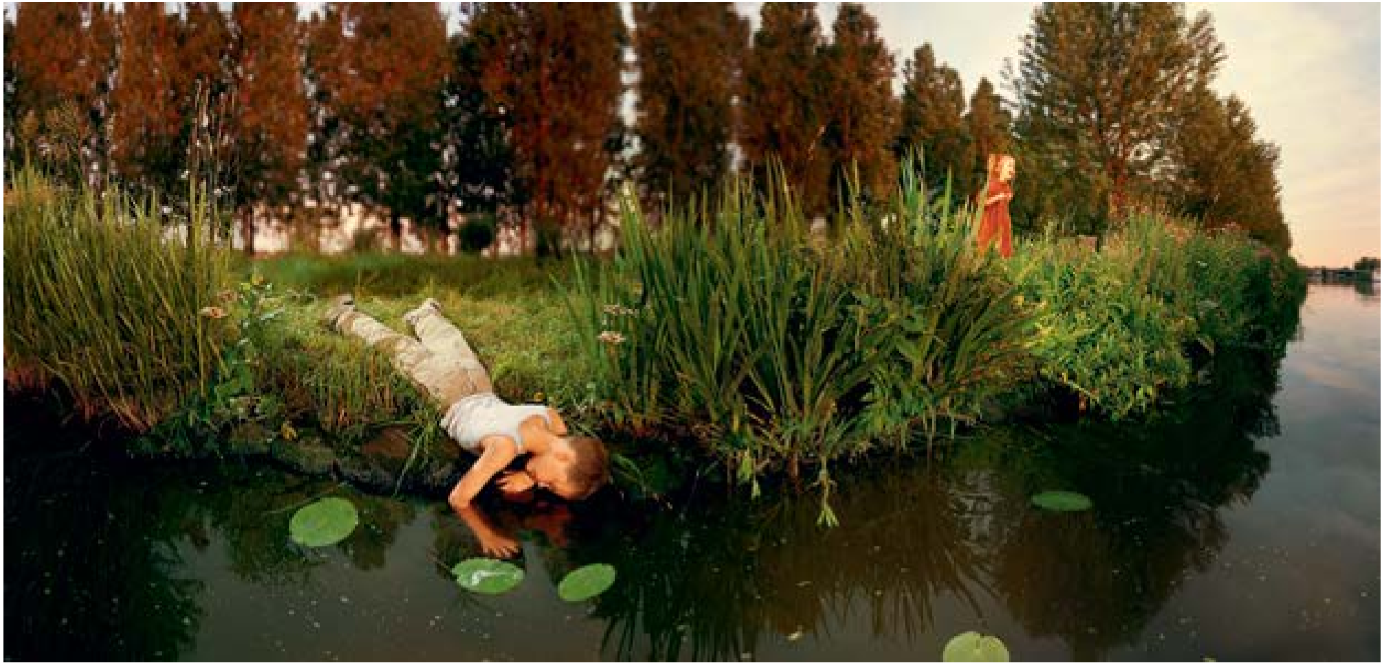
Alphen aan de Rijn – waterkant , 2002-2003 90 x 187 cm