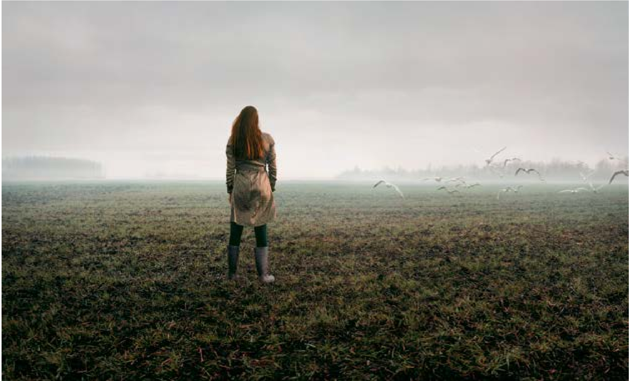
Sirjansland – meeuwen , 2009 90 x 148 cm