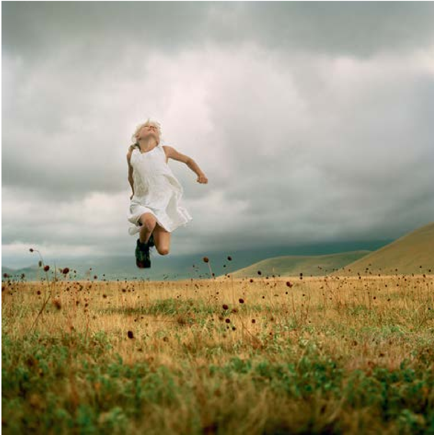
Sibilini – Rim , 2006 90 x 90 cm