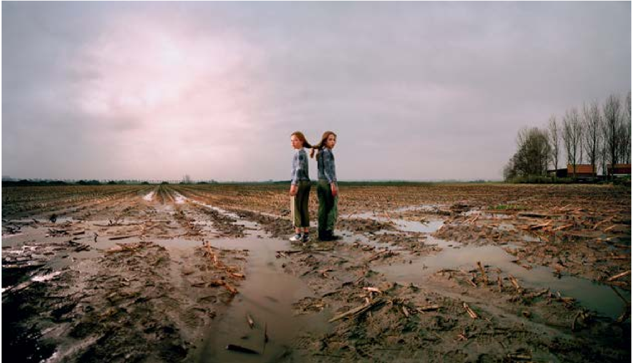
Abbekerkerk – tweeling , 2005 100 x 173 cm