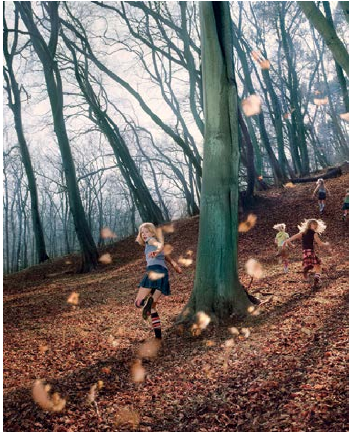
Overveen – klif , 2007 100 x 226 cm