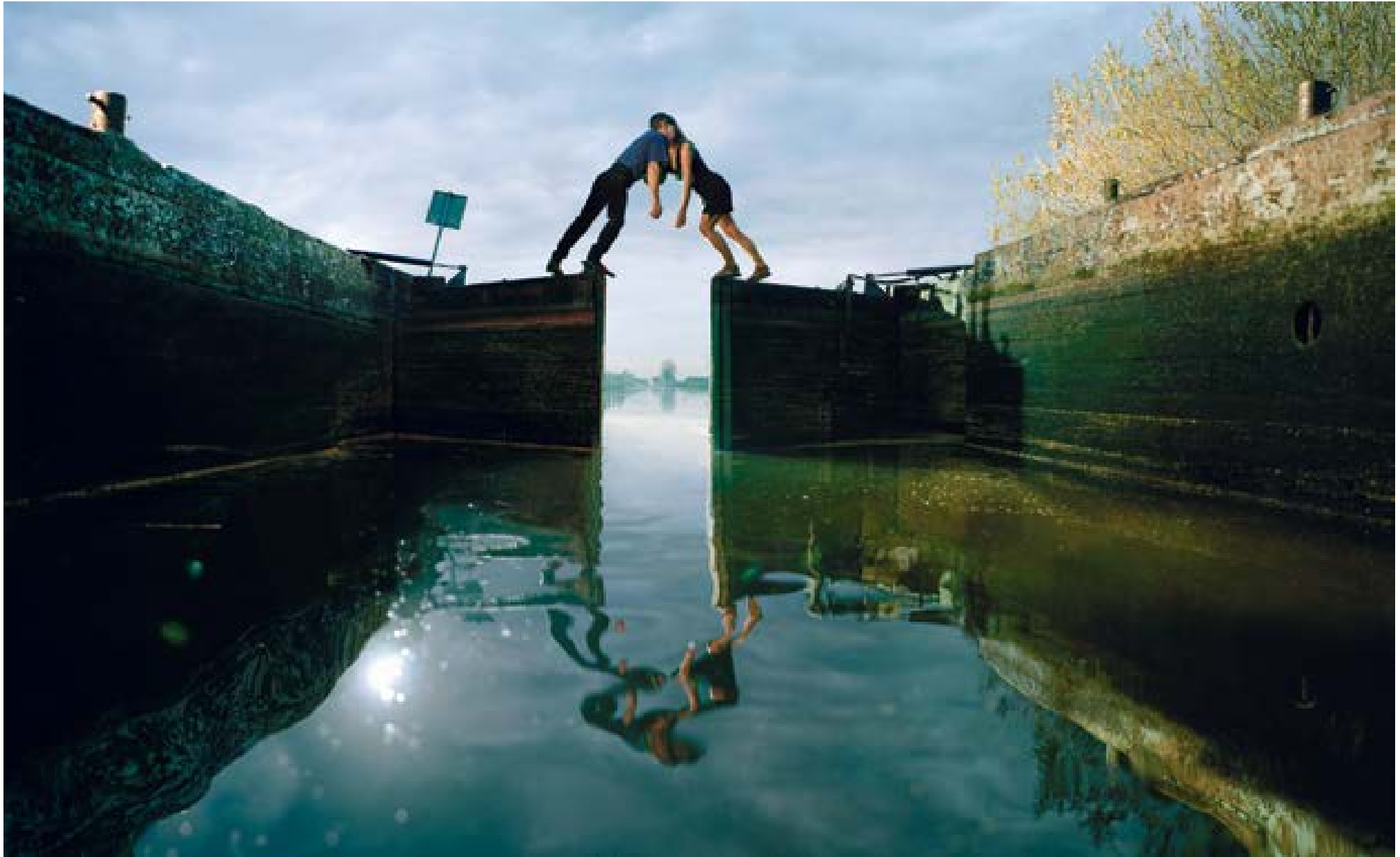
Nieuwkoop – sluis , 2004 100 x 162 cm