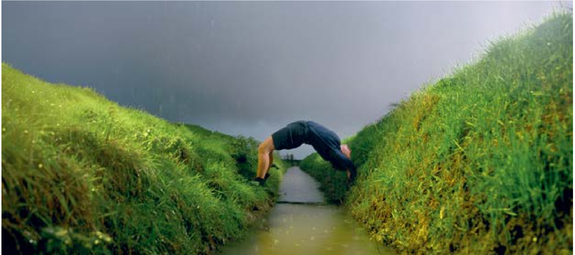
Velserbroek – de brug, 2000 85 x 192 cm