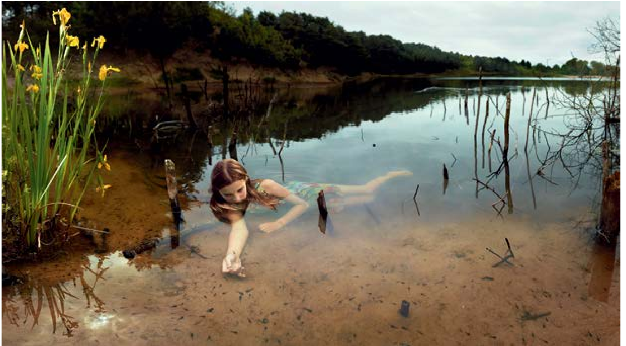
Duinmeer – lissen, 2012 100 x 179 cm