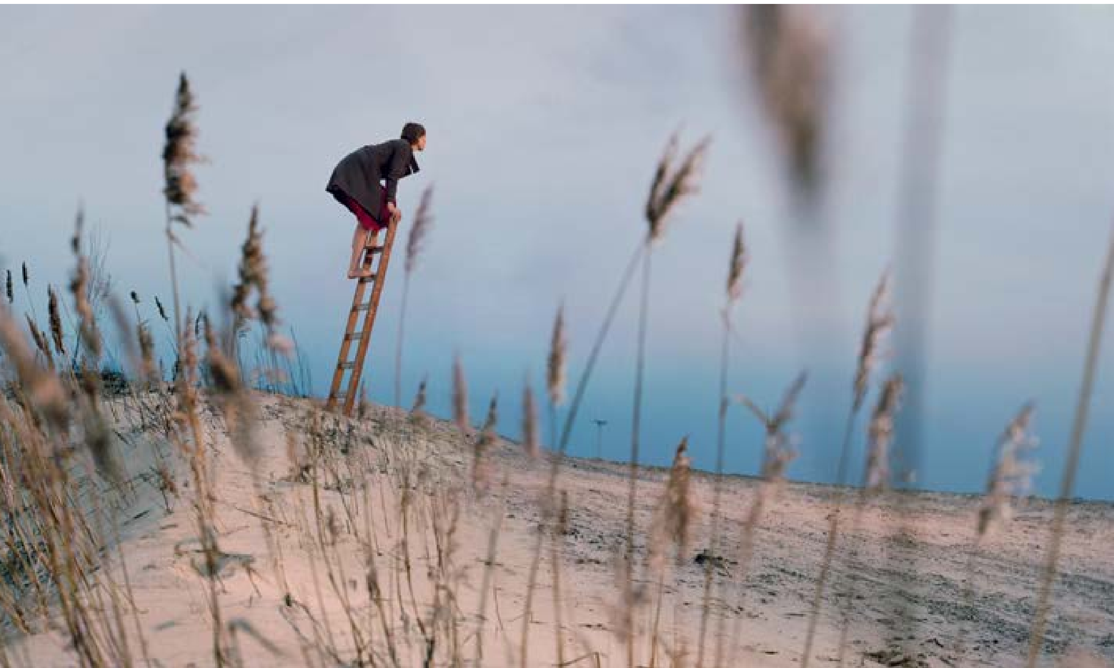
Nauerna – ladder , 2010 80 x 275 cm