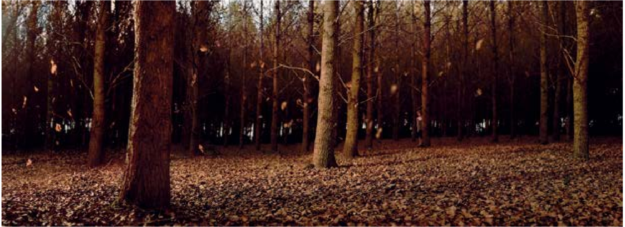
Blijha – woodlands , 2012 90 x 248 cm