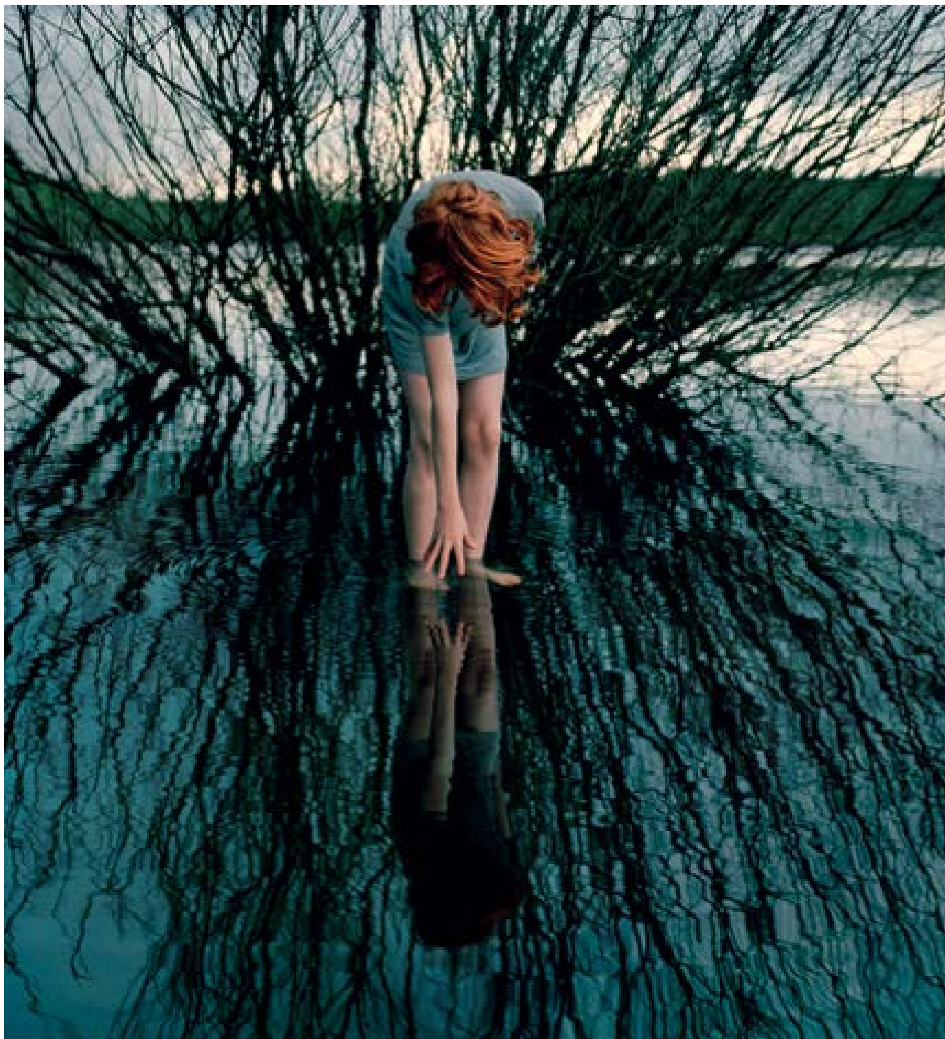
Oosterplas – reflection , 2012 100 x 91,5 cm