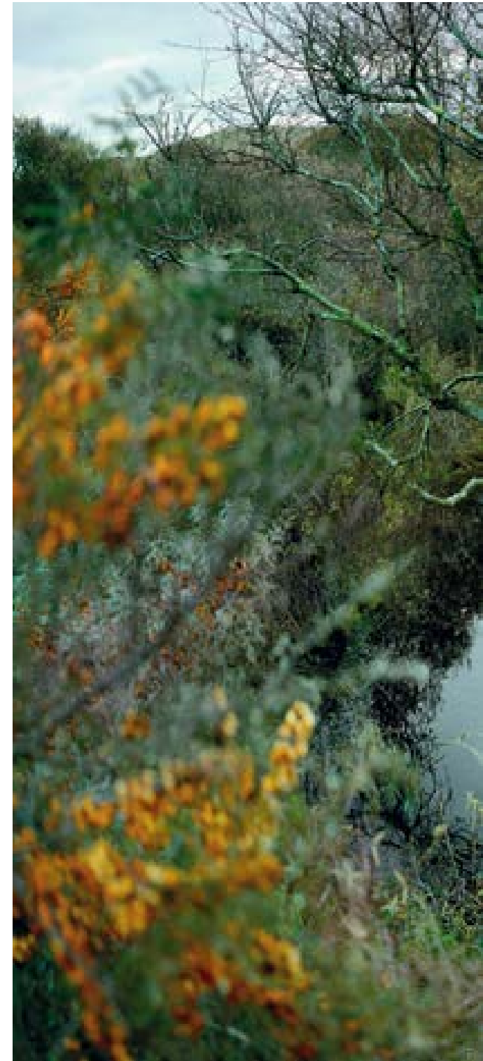
Langerak – blauwe boom , 2014 90 x 171 cm