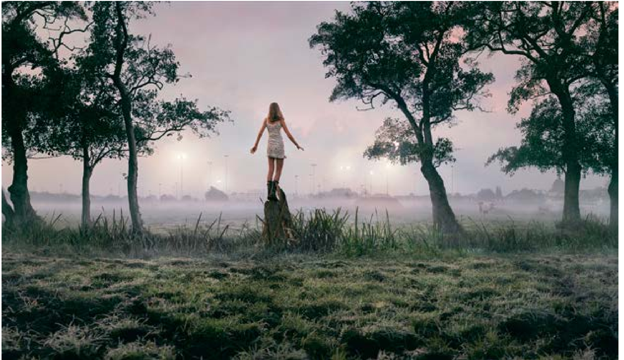
Velsen – lampen , 2008 100 x 172 cm