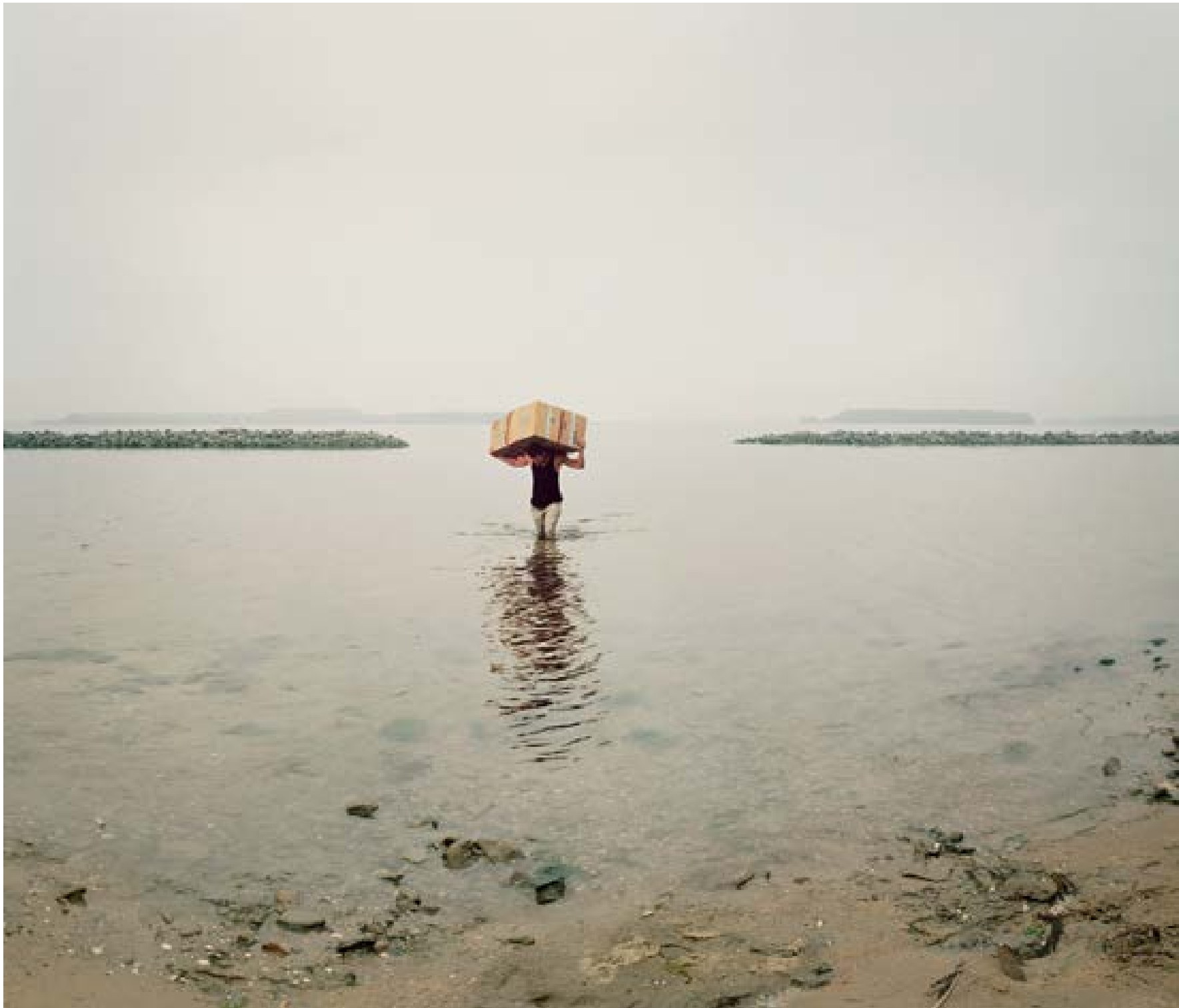
Veere – atlas, 2007 100 x 117 cm