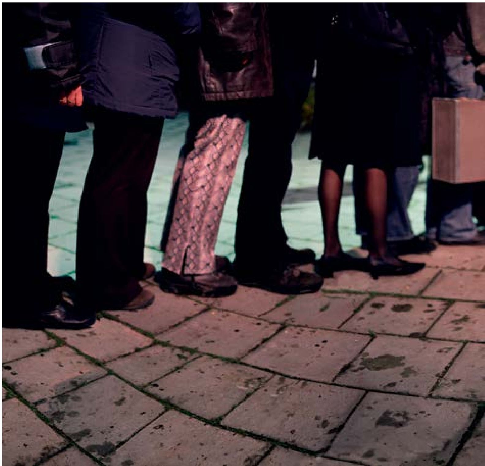
Alphen aan de Rijn – pad , 2003 85 x 213 cm