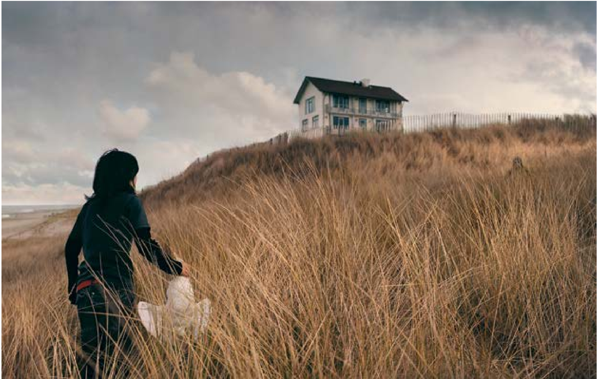
Bergen – duinhuis, 2009 100 x 172 cm