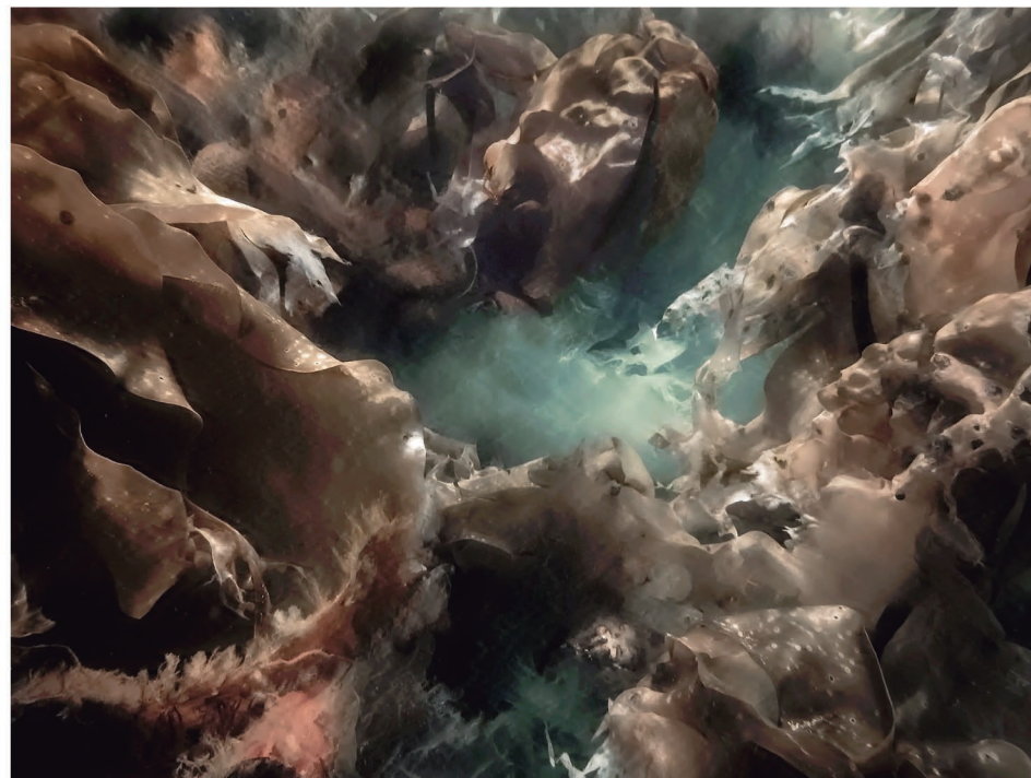
Ruth Peche, Entropía , 2014