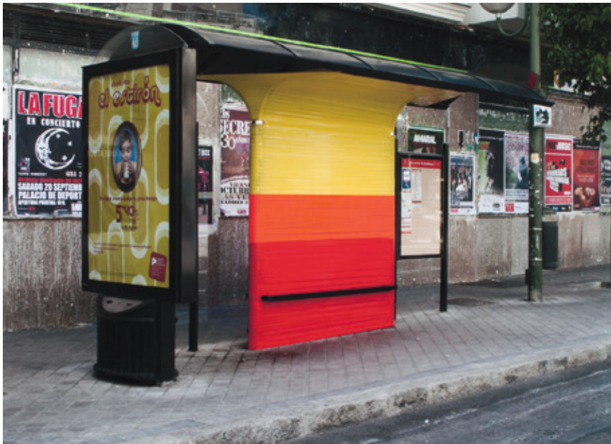
Marlon Azambuja Potencial escultórico, [barrera mex], 2009 Fotografía a color 33 x 42 cm