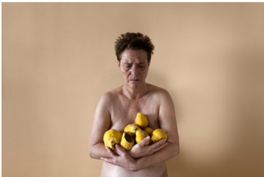
Beatriz Polo Iañez L'illa, 2015

Los fotógrafos del Máster PHotoEspaña. Teoría y prácticas artísticas en PIC.A Escuela Internacional Alcobendas PHotoEspaña presentan una selección de obras reflexionando sobre el tiempo, partiendo de la idea de que la imagen fotográfica suspende el momento y existe en un instante continuo.