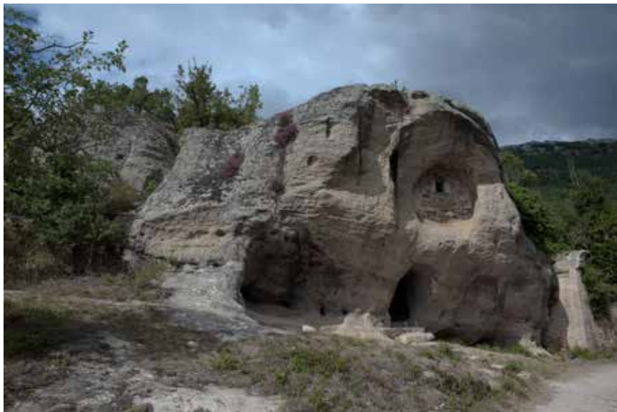
Ermita rupestre de San Acisclo y Santa Victoria. Arroyuelos. Cantabria. 746 msnm. 42° 50' 31" N - 3° 51' 37" O