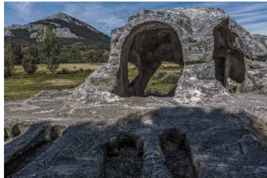
Ermita rupestre de San Vicente. Cervera de Pisuerga. Palencia. Altitud: 1.021 msnm. 42° 51' 27,5" N - 4° 29' 30,6" O