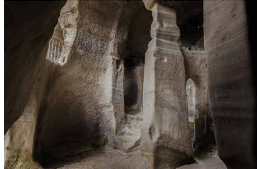
Ermita rupestre de San Miguel. Presillas de Bricia. Burgos. 761 msnm. 42° 51' 20" N - 3° 52' 26" O

Exposición: 04/28 mayo 2016 Inauguración: Miércoles 04 mayo 19,30 H.