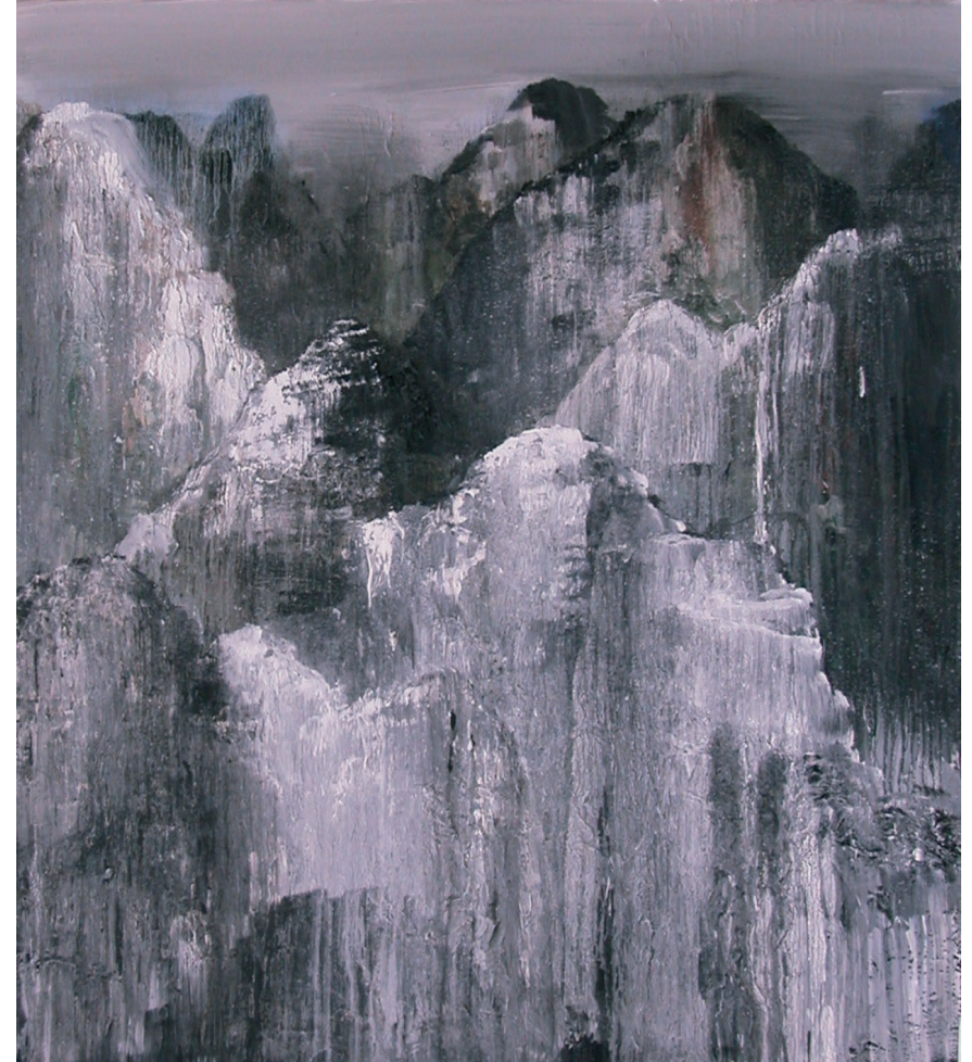
Yangshuo Montaña 19 180 x 160 cm