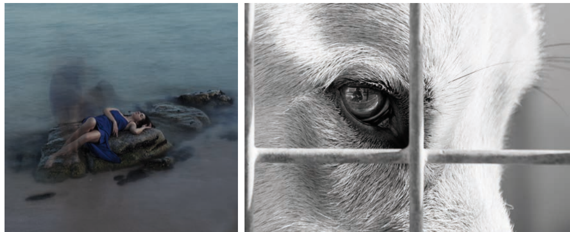
Adrián Teixeira. Sin título , 2015. Alberto Criado. La jaula , 2018.