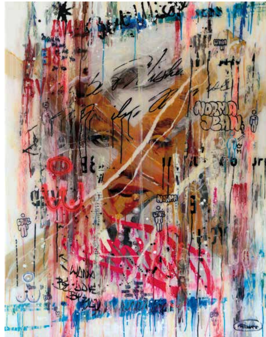
Norma Jean - 2018. Técnica mixta (acrílico, óleo, tintas pigmentadas y resina epoxi) sobre papel y lienzo montado en madera. 100x138x4 cm.