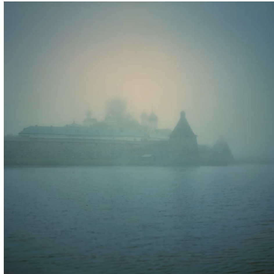
Kremlin del Monasterio Solovetsky.