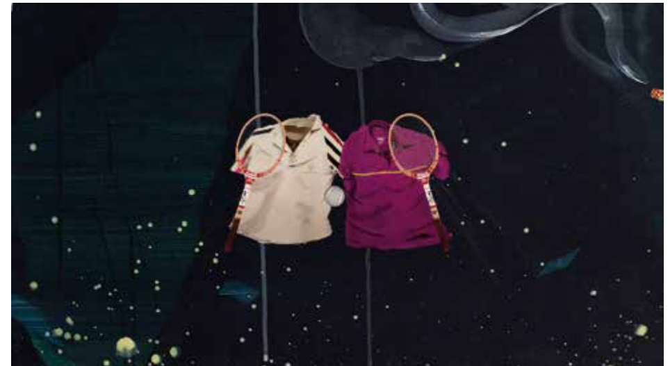
Jeux (2019/video). Video still.