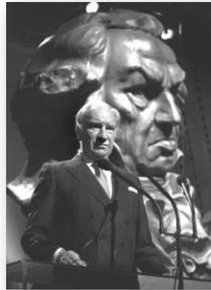
Fernán-Gómez fue receptor de la máxima cantidad de Goyas acumulada por ninguna otra figura del cine español