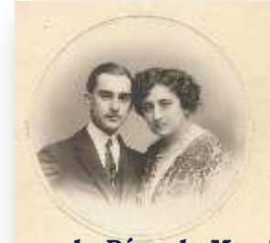
Fernando Díaz de Mendoza y María Guerrero (abuelos paternos)