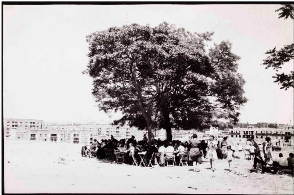
[Vivir en Madrid], 1966-1967