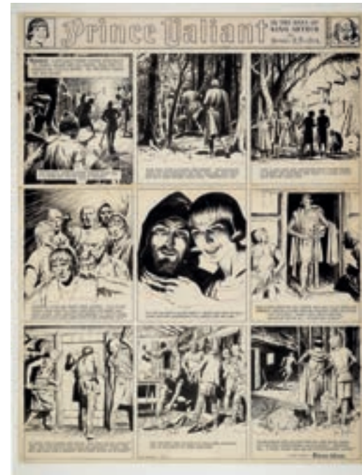
Prince Valiant, Harold Foster

Una oportunidad única para los amantes del noveno arte y todos aquellos que quieran descubrirlo desde sus orígenes.