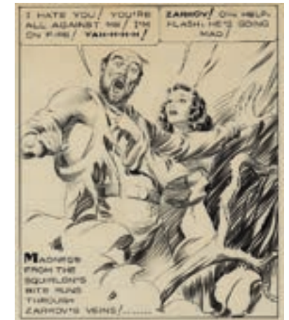
Flash Gordon, Alex Raymond