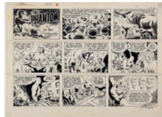
Phantom, Lee Falk & Sy Barry